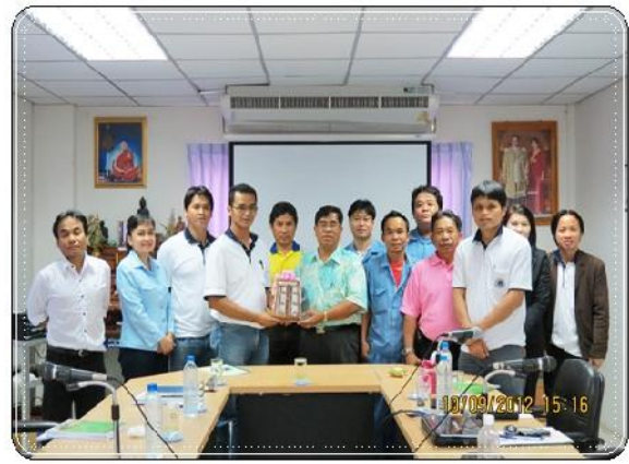
กรรมการฯ และเจ้าหน้าที่สหกรณ์เครดิตยูเนียนอีซูซุ เอ็นเจิ้น (ประเทศไทย) จำกัด เดินทางมาศึกษาดูงานสหกรณ์ออมทรัพย์ฯ (วันที่ 10 กันยายน 2555)