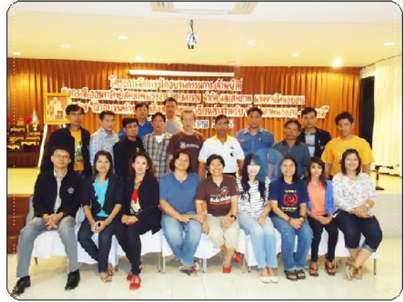
กรรมการฯ และเจ้าหน้าที่ฯ ร่วมโครงการหลักสูตร "ฝึกอบรมทักษะการสื่อสารและการเงินข่าว สำหรับนักสหภาพแรงงาน - สหกรณ์ฯ" ณ 27 รีสอร์ท จ.สุพรรณบุรี (วันที่ 25 - 26 สิงหาคม 2555)