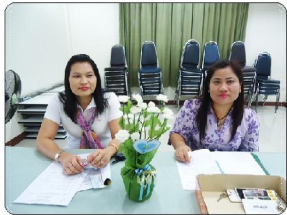
กรรมการและเจ้าหน้าที่สหกรณ์ฯ ร่วมศึกษาดูงานและประชุมในผู้สามัญประจำปี 2554 ของชมรมสหกรณ์จังหวัดอ่างทองที่จังหวัดกำแพงเพชร (วันที่ 21 - 22 กันยายน 2555)