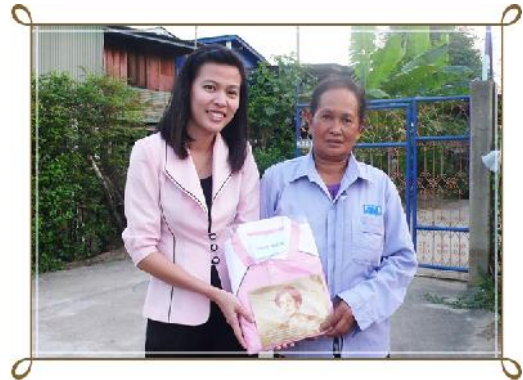
กรรมการสหกรณ์ฯ และเจ้าหน้าที่ฯ มอบของที่ระลึกให้กับสมาชิกที่ฝากเงินเข้าวงเงินฝากกับสหกรณ์ฯ (วันที่ 26 ธันวาคม 2555)