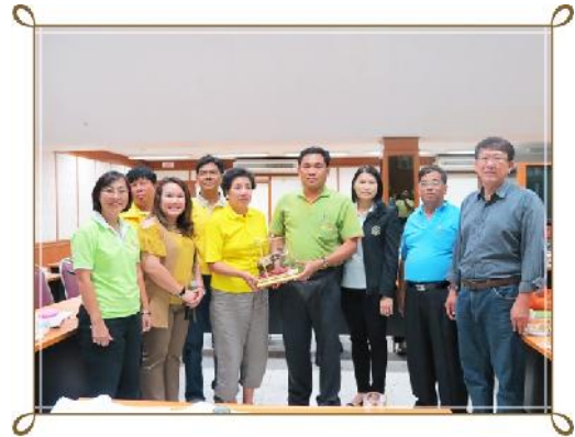
คณะกรรมการฯ และเจ้าหน้าที่สหกรณ์สมาชิกชมรมสหกรณ์ออมทรัพย์กรุงเทพพัฒนาเขตพื้นที่ 2 เยี่ยมชมกิจการสหกรณ์ออมทรัพย์ฯ (วันที่ 8 ธันวาคม 2555)