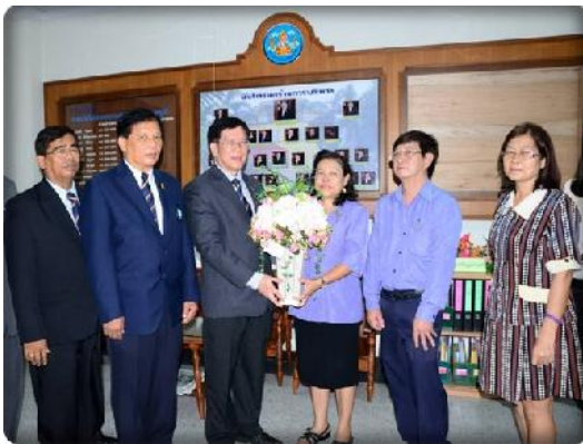
กรรรมการรชสอ. เข้าพบบรริฐมนตรีช่วยกระทรวงเกษตรและสหกรณ์ร ผู้ว่าราชการารจังหวัดนนทบุรี และบุคคลอื่น ๆ เนื่องในโอกาสเข้าดำรงตำแหน่งคณะกรรมการดำเนินกรรรมการรชุดที่ 41 (18 มิถุนายน 56)