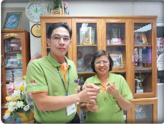
กรรรมการร มอบสร้อยคอทองคำ แก่สมาชิก เกษียณอายุ ณ ที่ทำการสหกรณ์ (1 มิถุนายน 2556)