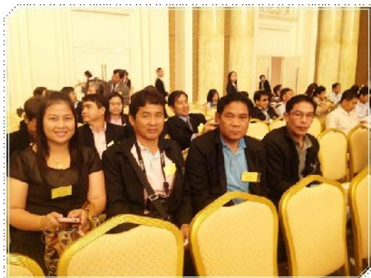
กรรมการฯ และเจ้าหน้าที่ฯ เข้าร่วม การประชุมใหญ่สามัญประจำปี 2556 ของ ชสอ. (8 มิถุนายน 2556)