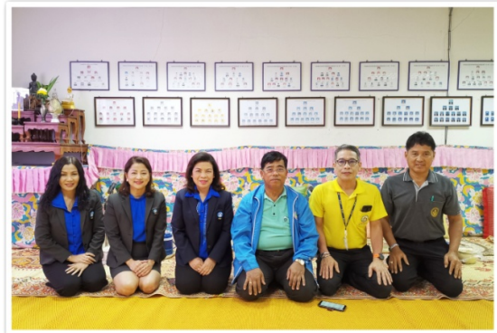
ผู้ช่วยผู้จัดการใหญ่ ชสอ. และเจ้าหน้าที่ ชสอ. เข้าร่วม ทำบุญตักบาตรเนื่องในโอกาสครบรอบ 36 ปีสหกรณ์ (22 สิงหาคม 2562)