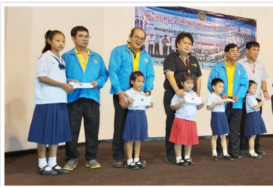
ประธานบริษัทฯ และกรรมการสหกรณ์ฯ ร่วมกันมอบ ทุนการศึกษาแก่บุตรสมาชิกสหกรณ์ฯ (24 สิงหาคม 2562)