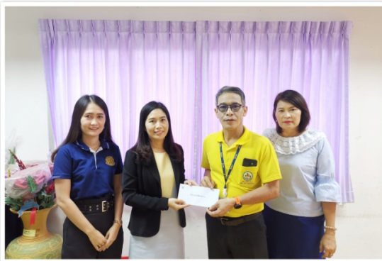
เจ้าหน้าที่สำนักงานตรวจบัญชีสหกรณ์อ่างทอง เข้าร่วม ทำบุญตักบาตรเนื่องในโอกาสครบรอบ 36 ปีสหกรณ์ (22 สิงหาคม 2562)