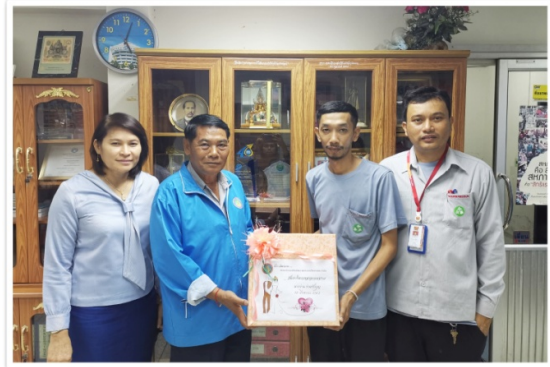
กรรมการฯ มอบของที่ระลึกให้แก่หน่วยงาน ร่วมรักบุญ สมาชิกแผนกเวอร์คชอป เนื่องจากการมงคลสมรส (20 สิงหาคม 2562)