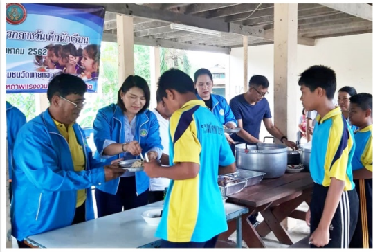
กรรมการและเจ้าหน้าที่ฯ ร่วมกันเลี้ยงอาหารกลางวัน เด็กนักเรียนโรงเรียนชุมชนวัดพายทอง (8 สิงหาคม 2562)