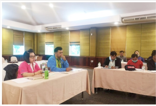
เลขานุการสหกรณ์ฯ เข้าร่วมการสัมมนากับพีพีอีแอนด์พี แรงงานไทย ที่ อ.เมือง จ.นครนายก (29 - 30 สิงหาคม 2563)