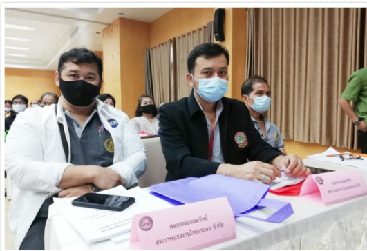
กรรมการและเจ้าหน้าที่ฯ เข้าร่วมอบรมโครงการเพิ่มศักยภาพคณะกรรมการสหกรณ์สู่ความเข้มแข็ง ประจำปี งบประมาณ พ.ศ. 2563 ณ ห้องประชุมชั้น 2 อาคารองค์การบริหารส่วนจังหวัดอ่างทอง (23 กันยายน 2563)