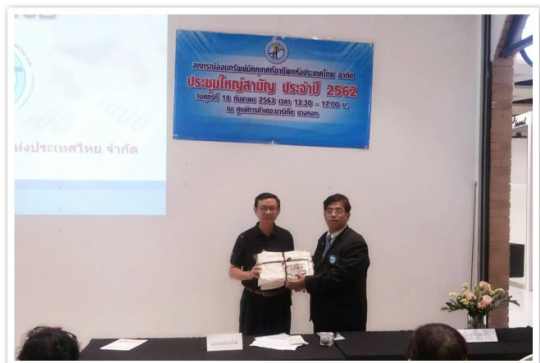
นายกสสอป. และเลขานุการเข้าร่วมการประชุมใหญ่ สอ.มัครุเทศน์อาชีพแห่งประเทศไทย จำกัด (18 กันยายน 2563)