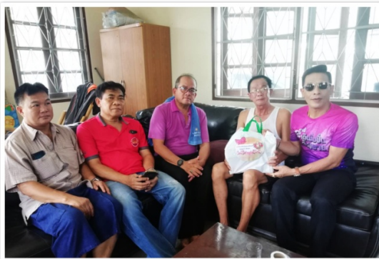
กรรมการฯ เยี่ยมไปรษณีย์ปริษา ศรีกาลนนท์ (พินสภาพฯ) ที่บ้านพัก ต.โพสะ อ.เมืองอ่างทอง จ.อ่างทอง (12 กันยายน 2563)