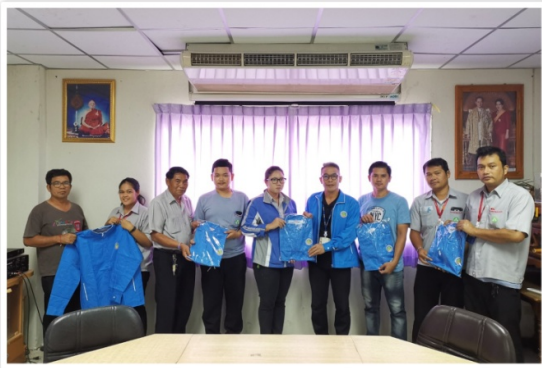
สหกรณ์ฯ ทำการอบรมสมาชิกใหม่ ประจำเดือนกันยายน และมอบเสื้อแจ็คเก็ตให้สมาชิกด้วย (10 กันยายน 2562)