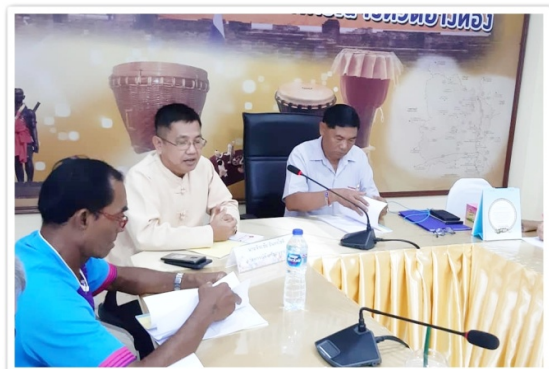
รองประธานและผู้จัดการฯ เข้าร่วมการประชุม คณะกรรมการบริหารชมรมสหกรณ์จังหวัดอ่างทอง (17 กันยายน 2562)