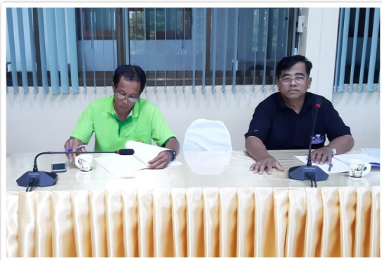
รองประธานสหกรณ์ฯ เข้าร่วมประชุมคณะกรรมการ สันนิบาตสหกรณ์จังหวัดอ่างทอง (17 กันยายน 2562)