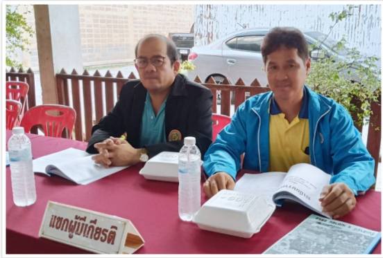
กรรมการฯ เข้าร่วมการประชุมใหญ่สหกรณ์ออมทรัพย์ สหภาพแรงงานสหกิจวิศาล จำกัด อ.แก่งคอย จ.สระบุรี (6 เมษายน 2562)