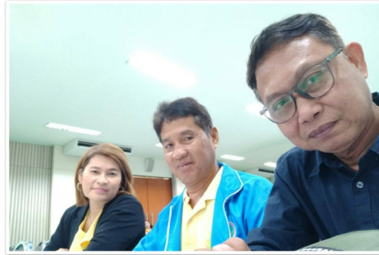
กรรมการและผู้จัดการฯ เข้าร่วมการอบรม เรื่อง “ทางหนี้อย่างไรให้ถูกกฎหมาย” ที่ สหกรณ์ออมทรัพย์คูดุ้ยธานี (8 เมษายน 2562)