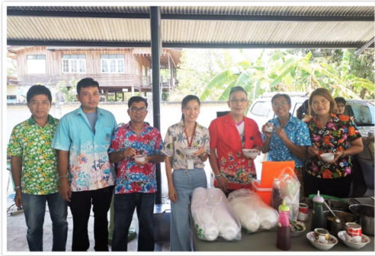
กรรมการและเจ้าหน้าที่ฯ เข้าร่วมงานวันสงกรานต์กับชมรมสหกรณ์จังหวัดอ่างทอง และสนับสนุนสหกรณ์จังหวัดอ่างทอง ณ สำนักงานสหกรณ์จังหวัดอ่างทอง อ.เมืองอ่างทอง จ.อ่างทอง (17 มิถุนายน 2562)