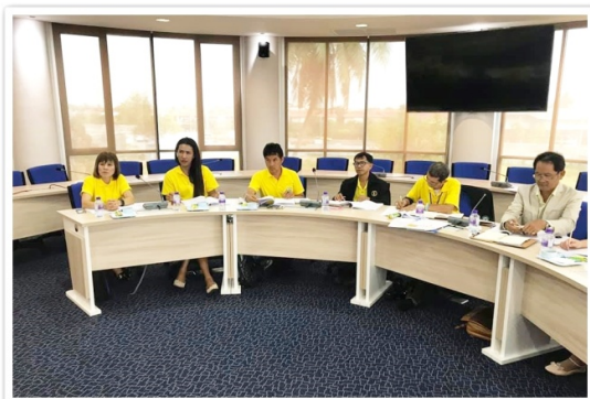
กรรมการฯ เข้าร่วมการประชุมคณะกรรมการ สสอป. ที่อาคาร สผ.สอ. จ.นนทบุรี (21 เมษายน 2562)