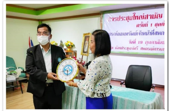
นายก สสอ. เข้าร่วมการประชุมใหญ่ สอ.เจ้าหน้าที่สหกรณ์นครสวรรค์ จำกัด (19 กุมภาพันธ์ 2564)