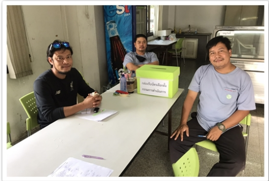
สหกรณ์ฯ จัดการเลือกตั้งกรรมการฯ ที่โรงงานหนองแค อ.หนองแค จ.สระบุรี (16 กุมภาพันธ์ 2564)