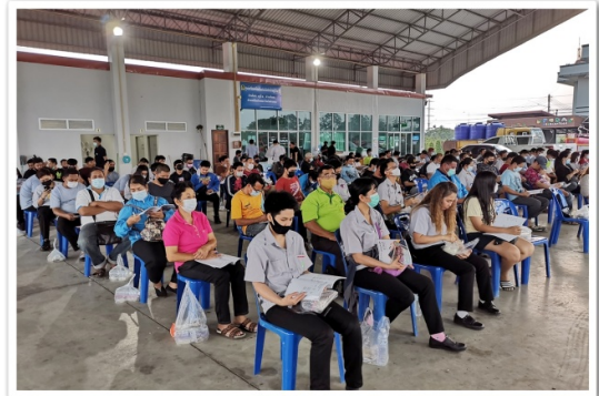
สมาชิกเข้าร่วมประชุมใหญ่สามัญ ประจำปี 2563 ณ โดมคลุมลานเอนกประสงค์เทศบาลตำบลโพสะ (16 กุมภาพันธ์ 2564)