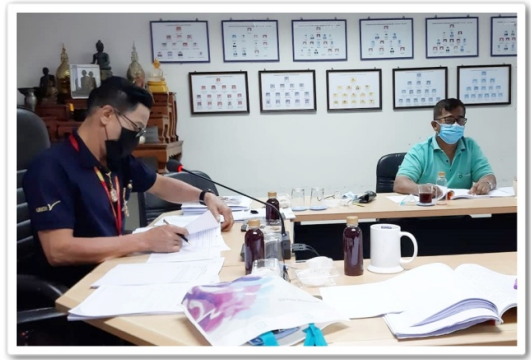
คณะกรรมการดำเนินการฯ ชุดที่ 39 และผู้จัดการฯ ทำการประชุมคณะกรรมการดำเนินการฯ ครั้งที่ 9 ณ ห้องประชุม “ศรีโพธิ์ วายุพัทธร” สำนักงานสภกรณ์ออมทรัพย์สหภาพแรงงานไทยเรยอน จำกัด (28 พฤษภาคม 2564)