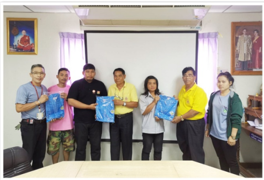
กรรมการมอบเสื้อแจ๊คเก็ตแก่สมาชิกที่เข้าร่วม การอบรมสมาชิกใหม่ ณ ที่ทำการสหกรณ์ฯ (14 พฤษภาคม 2562)