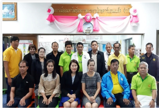
กรรมการและผู้จัดการฯ เข้าร่วมการประชุม ชมรมสหกรณ์จังหวัดอ่างทอง (17 มิถุนายน 2562)