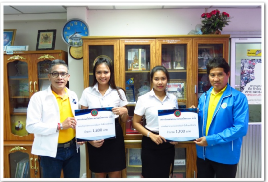
กรรมการฯ ร่วมกันมอบเงินค่าอาหารกลางวัน ให้แก่ นักศึกษา ทั้ง 2 คน ระหว่างการฝึกงาน (21 มิถุนายน 2562)