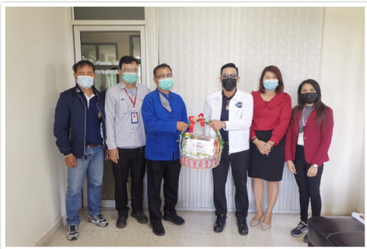
กรรมการและเจ้าหน้าที่ฯ นำกระเช้าของขวัญเพื่ออวยพร วันขึ้นปีใหม่ พ.ศ. 2564 หน่วยงานรัฐ (12 มกราคม 2564)