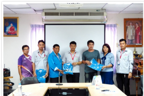
กรรมากรฯ มอบของที่ระลึกให้แก่สมาชิกใหม่ ที่เข้าร่วมการอบรมกับสหกรณ์ (12 พฤศจิกายน 2562)