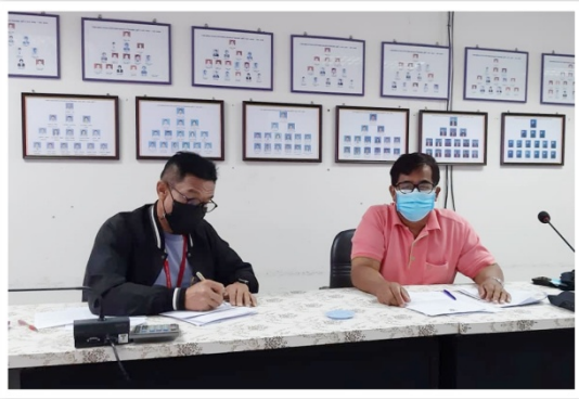
คณะกรรมการอำนวยการทำการประชุม ประจำเดือนกรกฎาคม 2564 (6 กรกฎาคม 2564)