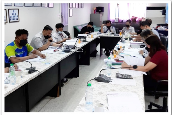
คณะกรรมการสหกรณ์ฯ ประชุม ครั้งที่ 9 ประจำเดือนกรกฎาคม 2564 (9 กรกฎาคม 2564)