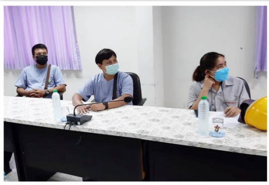
สหกรณ์ฯ จัดการอบรมสมาชิกใหม่ จำนวน 7 คน และทำการประชุมคณะกรรมการศึกษาและประชาสัมพันธ์ ณ ห้องประชุม “ศรีโพธิ์ วายุพักตร์” (13 กรกฎาคม 2564)