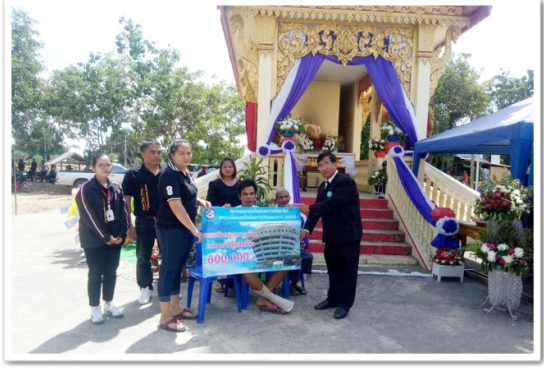
นายก สสอป. มอบเงินสงเคราะห์ 600,000.- บาท ให้แก่บุตรสมาชิกสมาคมฯ ที่ อ.ตาคลี จ.นครสวรรค์ (18 กรกฎาคม 2562)