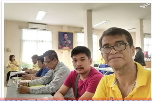
กรรมการฯ เข้าร่วมการอบรม “การพัฒนา ศักยภาพผู้บริหารสหกรณ์ฯ” ที่อ่างทอง (20 - 21 มิถุนายน 2562)