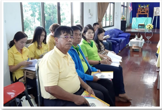
กรรมการและผู้จัดการฯ เข้าร่วมประชุมใหญ่สามัญประจำปี 2561 สหกรณ์การเกษตรไชโย จำกัด (10 กรกฎาคม 2562)