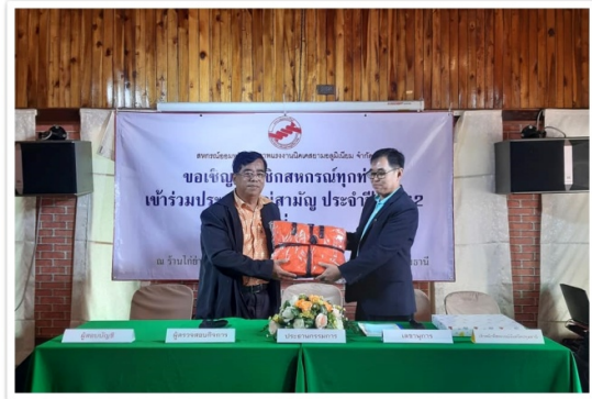
นายก สสอ.ป. เข้าร่วมการประชุมใหญ่สหกรณ์ออมทรัพย์ สหภาพแรงงานนิคส์สยามออลูมิเนียม จำกัด จ.ปทุมธานี (8 มีนาคม 2563)