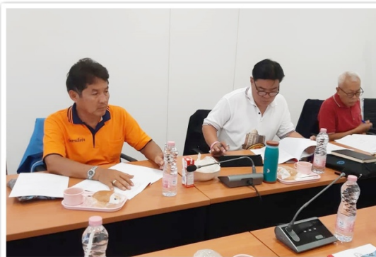
เหรียญเชิญเข้าร่วมการประชุมคณะกรรมการ สสอ.ป. ประจำเดือนมีนาคม 2563 จ.นนทบุรี (8 มีนาคม 2563)