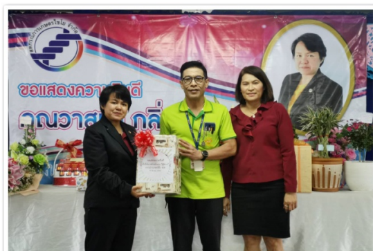
ประธานและผู้จัดการฯ มอบของที่ระลึกแก่ผู้จัดการ สหกรณ์การเกษตรไชโย จำกัด เนื่องจากรับตำแหน่งใหม่ (10 มีนาคม 2563)