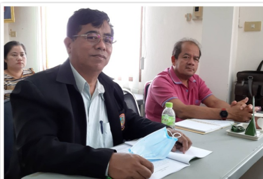
กรรมการและที่ปรึกษา ร่วมมอบบรมและประชุมใหญ่วิสามัญ สันนิบาตสหกรณ์จังหวัดอ่างทอง (13 มีนาคม 2563)