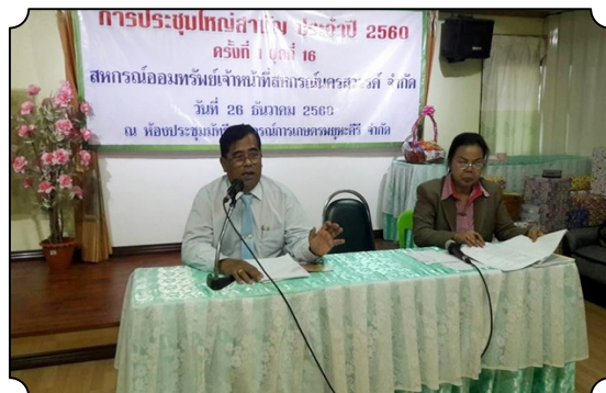
นายก สสอป. และกรรมการ เข้าร่วมประชุมใหญ่ สภกรณ์นครสวรรค์ จำกัด (26 ธ.ค. 60)