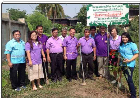
ที่ปรึกษาสภรณ์ฯ กรรมการ และผู้จัดการ ร่วมปลูกต้นมะม่วง เนื่องในวันสภรณ์แห่งชาติ