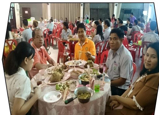
กรรมการฯ และเจ้าหน้าที่สภกรณ์ฯ ร่วมงานเลี้ยง สังสรรค์สมาชิกที่เกษียณอายุ (26 มี.ค. 58)