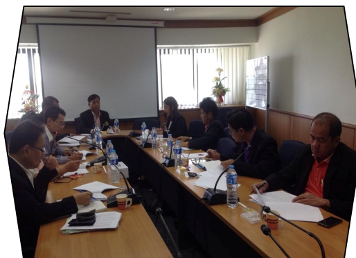
นายกสมาคม สสอป. และกรรมการฯ เข้าร่วม การประชุมคณะกรรมการสมาคมฯ ครั้งที่ 1 (29 มี.ค. 58)