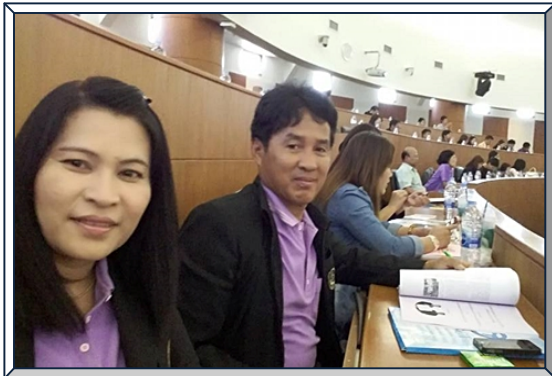
รองประธานฯ และผู้จัดการ เข้าร่วมสัมมนากับ ชสอ. ที่ จ.นนทบุรี (16 พ.ค. 58)