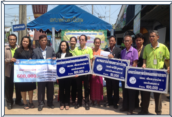
นายกสมาคม สสอ.ป. กรรมการ และเจ้าหน้าที่ฯ มอบเงินสงเคราะห์ จำนวน 600,000 บาท แก่ทนายทสาชิก สมาคมฯ ที่เสียชีวิต ณ ที่ทำการศูนย์ประสานงานสหกรณ์ออมทรัพย์วายุวิปทุม จำกัด จ.มหาสารคาม (29 เม.ย. 58) และสหกรณ์ออมทรัพย์พนักงานสหกรณ์สุรินทร์ จำกัด จ.สุรินทร์ (23 พ.ค. 58)