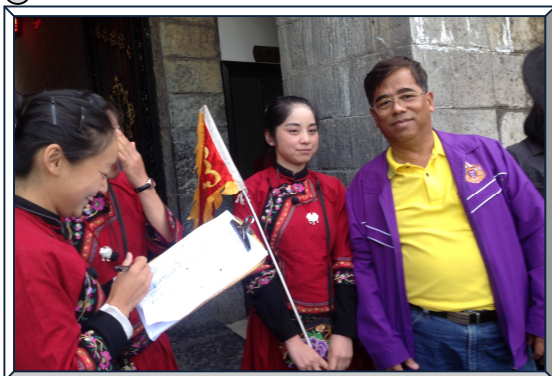
กรรมการ ชสอ. และที่ปรึกษาสหกรณ์ฯ พร้อมกับผู้เข้าร่วมการสัมมนา คณะกรรมการ ชสอ. เจ้าหน้าที่ ชสอ. เดินทางไปทัศนศึกษาเมืองจางเจี๋ยเจี๋ย เมืองฉางซา สาธารณรัฐประชาชนจีน (10 - 14 พ.ค. 58)