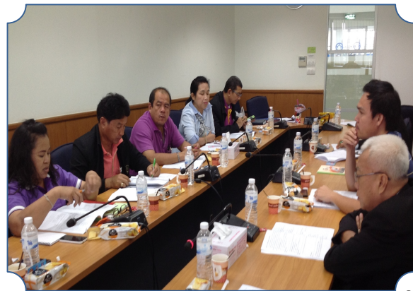
ที่ปรึกษาฯ ประธานฯ และรองประธานฯ ร่วมประชุม ประจำเดือนคณะกรรมการ สสอป. (28 เม.ย. 58)