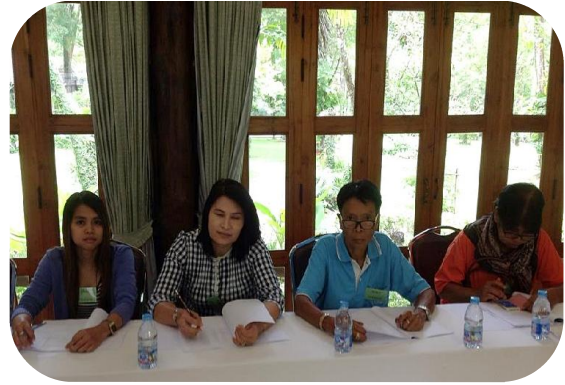
เจ้าหน้าที่สภกรณฯ ร่อบมรกับมูณนิธิสภานแรงงาน ไทเบรอน ที่จังหวัดนครนายก (30-31 ส.ค. 57)