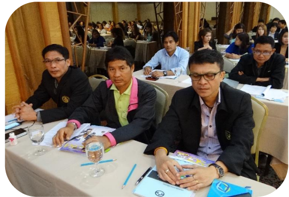
กรรมการลันเชื้อ 5 คน เข้าร่วมการอบมรกับ ชลอ. ที่ชะงำ (3-4 ก.ย. 57)