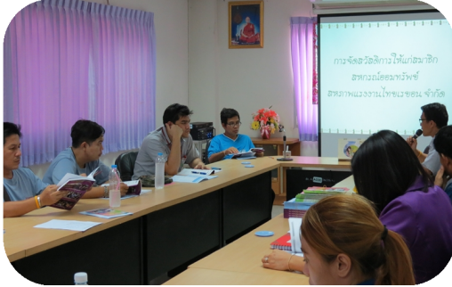
สหกรณ์ฯ จัดอบรมสมาชิกใหม่ เพื่อให้ความรู้เกี่ยวกับสหกรณ์ฯ ด้านการออมเงิน การกู้เงิน และการเข้าร่วมกิจกรรมกับสหกรณ์ฯ ในด้านต่างๆ โดยมีกรรมการ และผู้จัดการ เป็นวิทยากร (10 พ.ค.59)