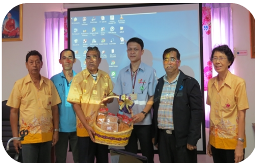
สหกรณ์ฯ เคารติดูเยนบ้านบ่อแร่ จำกัด มอบกระเช้าขนมให้แก่ประธานฯ เนื่องจากขอใช้สถานที่จัดอบรมกรรมการ และเจ้าหน้าที่ฯ (13 พ. ค. 59)