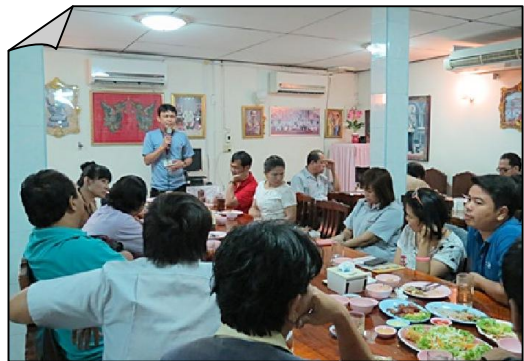
คณะกรรมการธรรมกรณีย์ และกรรมการสหภาพฯ เดินทางไปพบปะสมาชิกที่โรงงานหนองตอ จ.สระบุรี