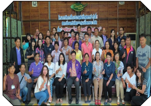
สหกรณ์ฯ จัดอบรมสมาชิก ประจำปี 2558 รุ่นที่ 1 เรื่อง “การสร้างความมั่นคงให้ครอบครัวโดยวิธีการสหกรณ์” ณ บ้าน กล้วย กล้วย รีสอร์ท อ.เมือง จ.นครนายก (31 - 1 มิ.ย. 58)