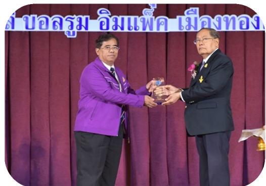
ที่ปรึกษาสหกรณ์ฯ ประธานกรรมการฯ รับมอบโล่เกียรติคุณ ในวันประชุมใหญ่สามัญประจำปี 2558 ของ ชสอ. (6 มิ.ย. 58)