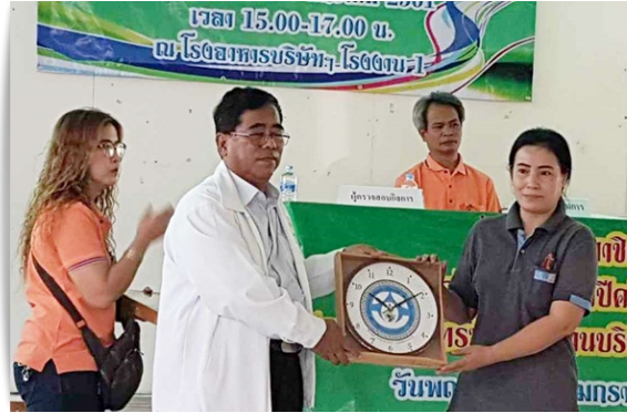
นายกสสอป. มอบนาฬิกาสมาคมฯ รวม 9 เรือน ให้แก่สมาชิก สอ.พนักงานบริษัทรอยัล ปอร์เชล จำกัด ที่ อ.แก่งดอย จ.สระบุรี (4 ม.ค.61)