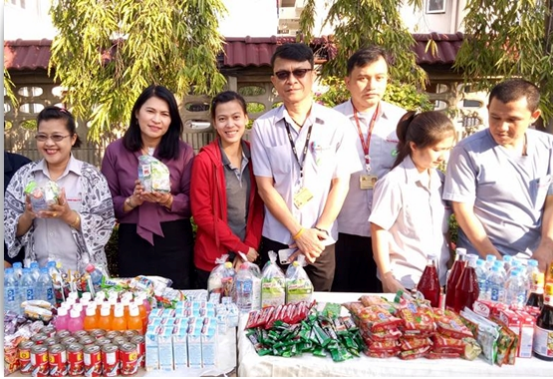
กรรมการฯ และเจ้าหน้าที่ฯ ร่วมตักบาตรข้าวสารอาหารแห้งในวันขึ้นปีใหม่ของบริษัทฯ (4 ม.ค.61)