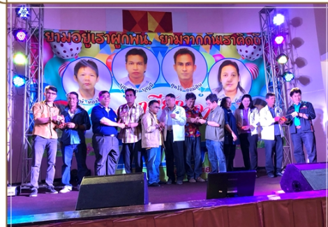
สมาชิกแผนกวิศโคส ผลิต จำนวน 6 คน