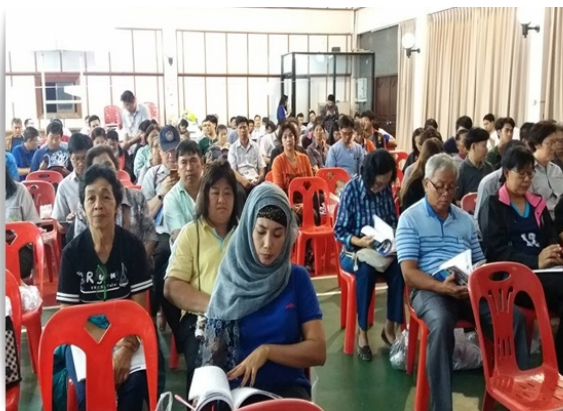
สหกรณ์ฯ จัดการประชุมใหญ่สามัญประจำปี 2560 ณ สโมสรพนักงานบริษัทไทยเรยอน จำกัด (31 ม.ค. 61)