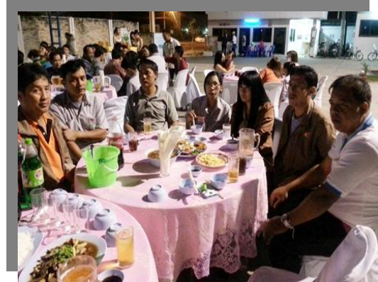
กรรมการ และเจ้าหน้าที่สภกรณ์ฯ ร่วมงานเลี้ยงสังสรรค์วันขึ้นปีใหม่ ที่โรงงานหนองแค (9 ม.ค. 58)