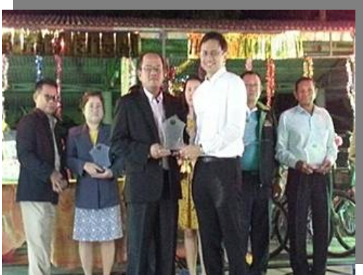
ประธานฯ รับมอบโล่ “เป็นสภกรณ์ผ่านเกณฑ์การจัดมาตรฐานระดับดีเลิศ ต่อเนื่อง 3 ปี” (29 ธ.ค. 57)