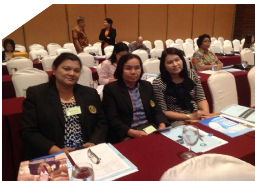
กรรมการ และเจ้าหน้าที่สทกรณฯ เข้าร่วมสัมมนา เรื่อง “เจาะประเด็นร้อนสทกรณต้องรู้” ณ โรงแรมริชมอนด์ จ.นนทบุรี