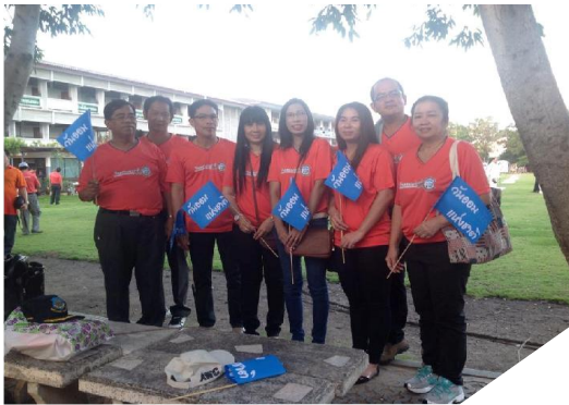
กรรมการ และเจ้าหน้าที่สทกรณฯ ร่วมเดินรณรงค์ งานวันออมแห่งชาติ ที่จังหวัดสุพรรณบุรี