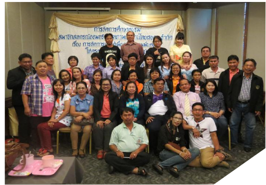
สทกรณฯ จัดอบรมสัมมนาประจำปี 2557 รุ่นที่ 2 ที่จังหวัดสุพรรณบุรี