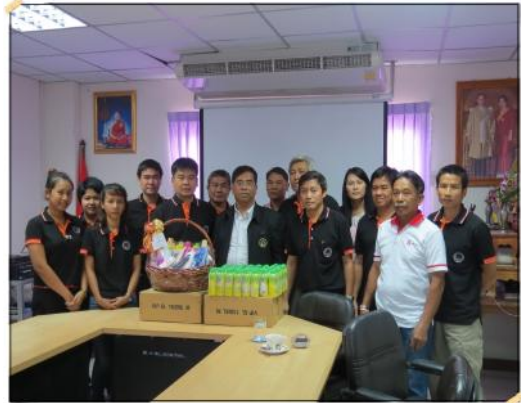
วันที่ 6 กันยายน 2556 คณะกรรมการสภกรณ์ บริการพนักงานกลุ่มบริษัทยูนิลีเวอร์ไทย จำกัด เข้าเยี่ยมชมกิจการและศึกษาดูงานกับสภกรณ์ฯ