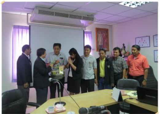
วันที่ 12 กันยายน 2556 ผู้แทนเครือข่าย ขบวนการสภกรณ์ในจังหวัดปทุมธานี เข้าเยี่ยม ชมกิจการและศึกษาดูงานกับสภกรณ์ฯ