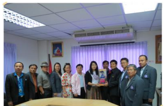
วันที่ 22 กันยายน 2556 คณะกรรมการชมรม สภกรณ์ออมทรัพย์ภาคกลาง เข้าเยี่ยมชม กิจการและศึกษาดูงานกับสภกรณ์ฯ