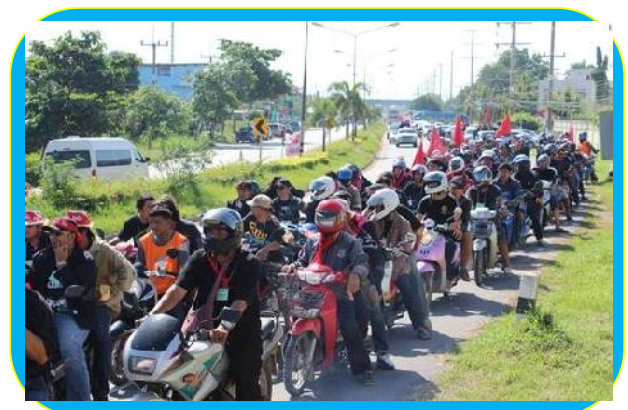
สมาชิกสหภาพฯ เคลื่อนขบวนไปยื่นหนังสือต่อผู้ว่าราชการจังหวัดอ่างทอง

ก็ยังไม่สามารถตกลงกันได้ ประเด็นข้อพิพาทแรงงานสำคัญที่สองฝ่ายไม่สามารถตกลงกันได้ คือ บริษัทฯ ขอลดเงินโบนัสที่เคยจ่ายให้แก่พนักงานสูงสุดคนละ 136 วัน เป็นการประกันเงินโบนัสขั้นต่ำจำนวน 45 วัน ส่วนเงินโบนัสที่จะได้เกินกว่า 45 วันให้นำผลกำไรในแต่ละปีร้อยละ 5 มาคำนวณการจ่ายเงินโบนัสที่เพิ่มขึ้น ขอลดเงินค่าครองชีพพนักงานที่เข้าทำงานใหม่หลังวันที่ 31 พฤษภาคม 2556 จากที่เคยจ่ายให้เดือนละ 5,000 บาท เหลือเดือนละ 3,000 บาท ขอลดเปอร์เซ็นต์การปรับค่าจ้างประจำปี จากที่เคยปรับให้แก่พนักงานตั้งแต่ 8 -11% เหลือ 4 -7 % ในขณะที่สหภาพฯ ยืนยันให้ บริษัทกำหนดจำนวนวันที่บริษัทต้องจ่ายเงินโบนัสเป็นตัวเลขที่แน่นอนโดยไม่ต้องนำผลกำไรในแต่ละปีมาพิจารณาเพื่อจ่ายเงินโบนัส และให้จ่ายเงินค่าครองชีพแก่พนักงานเท่ากันทุกคน รวมทั้งการขึ้นค่าจ้างประจำปีตามเปอร์เซ็นต์เดิม สำหรับข้อเรียกร้องฯ อื่นสองฝ่ายสามารถตกลงกันได้เป็นส่วนใหญ่ แต่ก็ยังมีบางข้อที่ยังตกลงกันไม่ได้ และอยู่ระหว่างการไต่เถียงของพนักงานประนอมข้อพิพาทแรงงาน