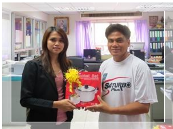
สหกรณ์ฯ มอบของที่ระลึกให้กับสมาชิกที่มียอดเงินฝาก และหุ้นจำนวนมาก