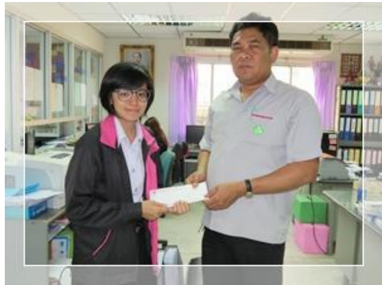
สหกรณ์ฯ เป็นเจ้าภาพสวดศพบิดานางสาวนกยูง รักชาว สมาชิกแผนกสปีนหนึ่ง ผลิต ที่วัดสุวรรณเจดีย์ จ.อยุธยา และช่วยเงินทำบุญ 500 บาท (วันที่ 26 มกราคม 2557)